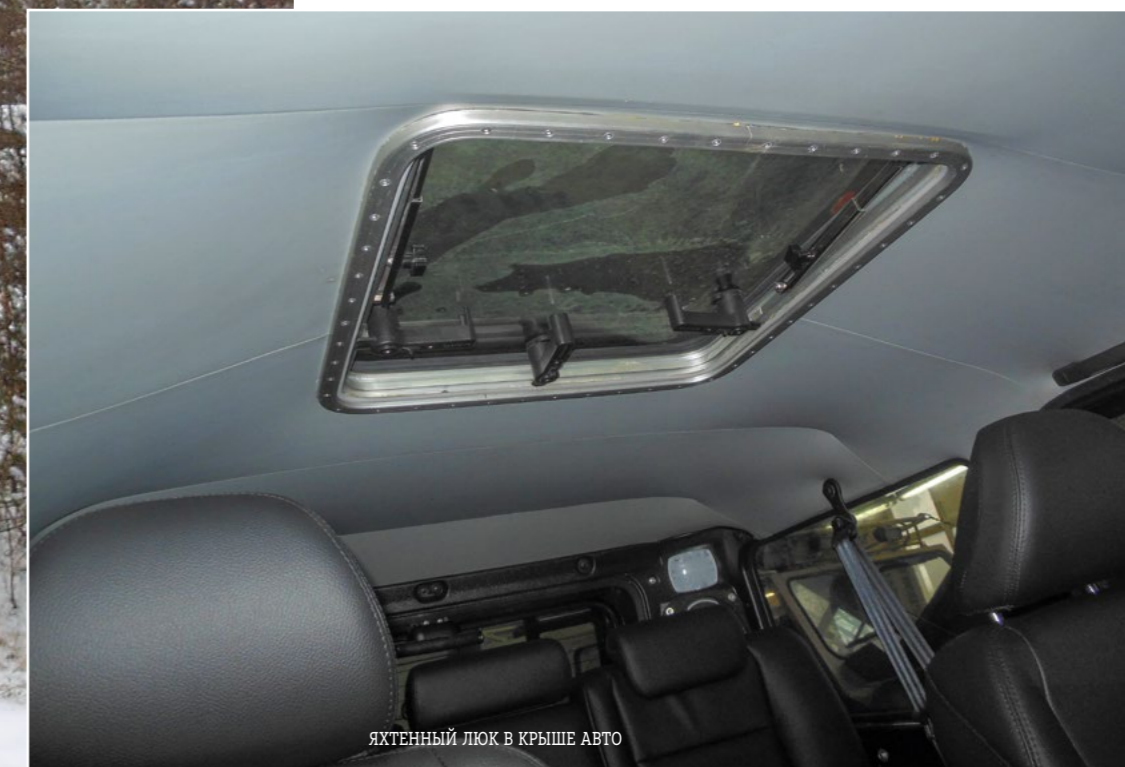
ЯХТЕННЫЙ ЛЮК В КРЫШЕ АВТО