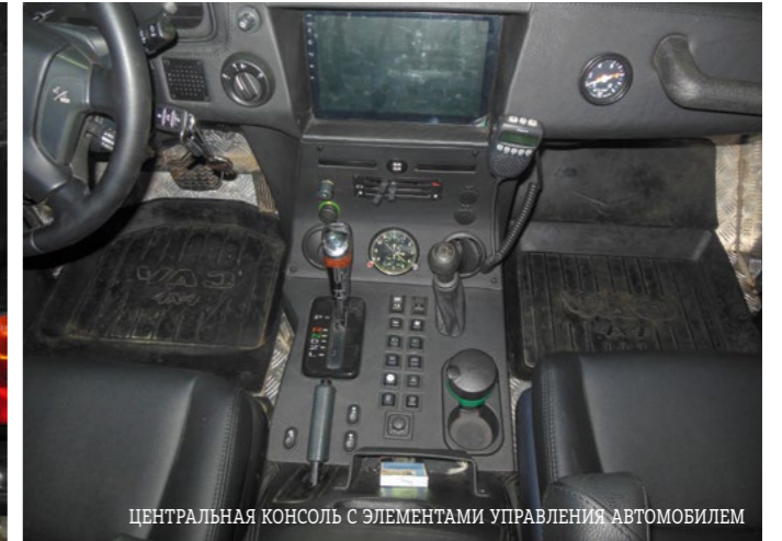
ЦЕНТРАЛЬНАЯ КОНСОЛЬ С ЭЛЕМЕНТАМИ УПРАВЛЕНИЯ АВТОМОБИЛЕМ