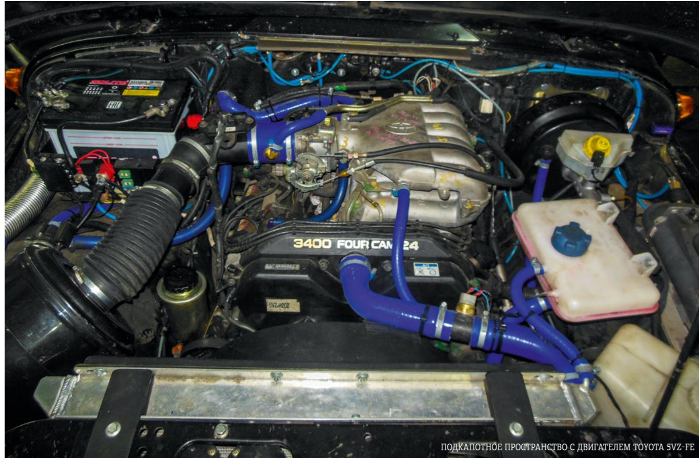
ПОДКАПОТНОЕ ПРОСТРАНСТВО С ДВИГАТЕЛЕМ TOYOTA 5VZ-FE