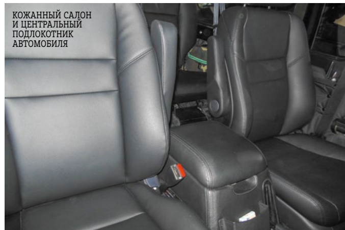
КОЖАНЫЙ САЛОН И ЦЕНТРАЛЬНЫЙ ПОДЛОКОТНИК АВТОМОБИЛЯ